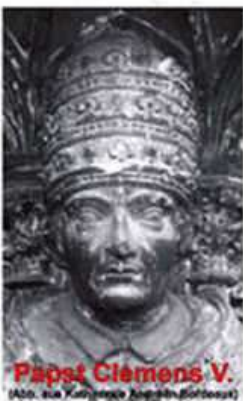
Papst Clemens V.