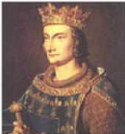
Philipp der Schöne

1307 - 1314 Gefangennahme Kerker, Folter Scheiterhaufen