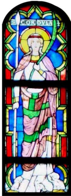
Cordula in Kunibertkirche/Köln

In der Kölner Kunibertkirche 5 soll sich die älteste Darstellung der Heiligen Cordula befinden. Im Chorraum der Kirche sind je ein Fenster der Heiligen Cordula und der Heiligen Ursula gewidmet. Beide Fenster entstanden um das Jahr 1220 und haben alle Zerstörungen des Gotteshauses fast ohne Schaden überstanden. Cordula ist mit Lanze und Palmwedel und einem Haarkranz abgebildet. Ursula hält in ihren Händen einen Pfeil und einen Palmwedel und auf dem Haupt trägt sie eine Krone.