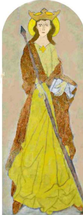
Cordula in Almersbacher Kirche