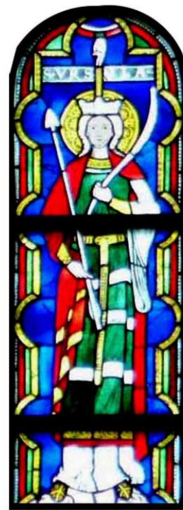
Ursula in Kunibertkirche/Köln

Was könnte der Grund gewesen sein, dass die Heilige Cordula in Almersbach in der Seitenkapelle einen Ehrenplatz erhielt? In Almersbach führte der bedeutende Handels- und Pilgerweg von Köln nach Frankfurt bzw. Mainz, der unterhalb der Kirche in einer Furt die Wied durchquerte, vorbei. Für die Reisenden befand sich hier höchstwahrscheinlich ein Hospital. Wurde dieses Hospital möglicherweise von Johanniterinnen 6 betreut, die sich zum Gebet in der Almersbacher Kirche einfanden? - Nach Einschätzung des Landesdenkmalamtes Mainz handelte es sich bei dem Wandbild in der Apsis des Seitenschiffes um ein seltenes Beispiel einer " Altar-Predella ", also einen bemalten Altarsockel. Damit wäre die Wandnische über dem Gekreuzigten eine Altarnische gewesen. 7